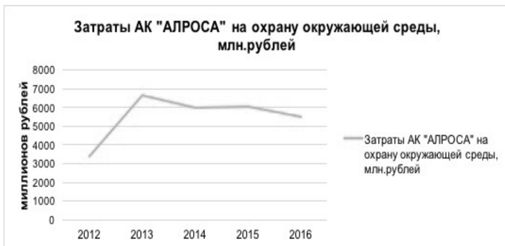
Рисунок 2. Затраты АК «АЛРОСА» на охрану окружающей среды, млн рублей 5