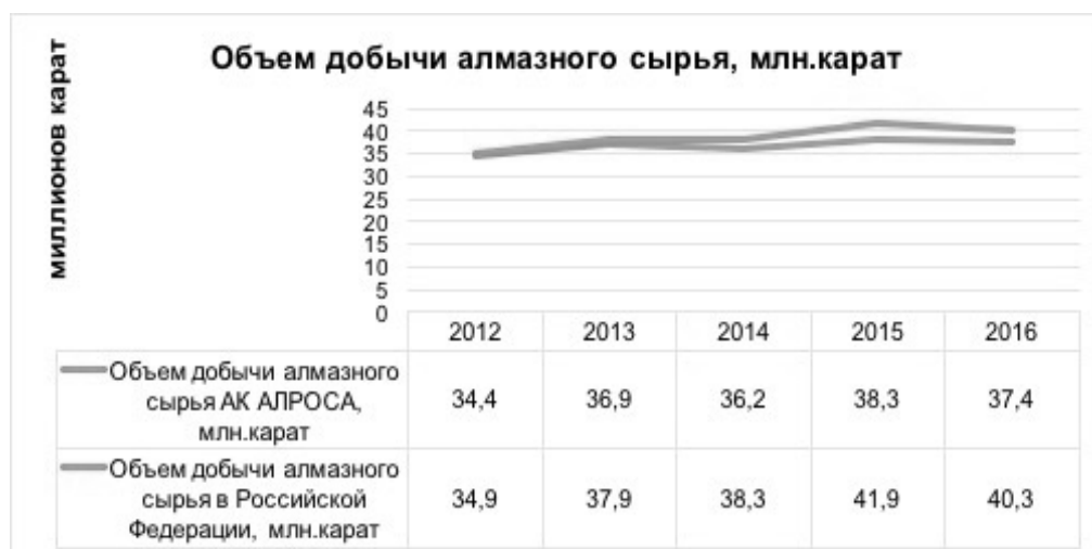
Рисунок 1. Объем добычи алмазного сырья, млн карат

С 2011 года в АК «АЛРОСА» разработана и внедрена программа мероприятий по охране окружающей среды. Ежегодно, в соответствии с требованиями российских и международных норм, в компании проводятся природоохранные мероприятия, такие как реконструкция и строительство новых очистных сооружений, модернизация системы экологического менеджмента, рациональное использование недр, обеспечение последними доступными технологиями по обращению с отходами от произ-